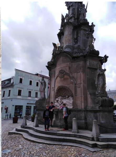
Sloup se sousoším Nejsvětější Trojice – tzv. „morový sloup“ na