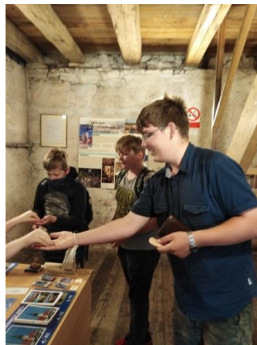
Ještě vstupenky a.....