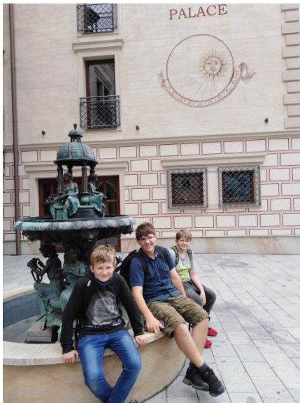
Odpočinek a nabírání sil u kašny. náměstí Míru.