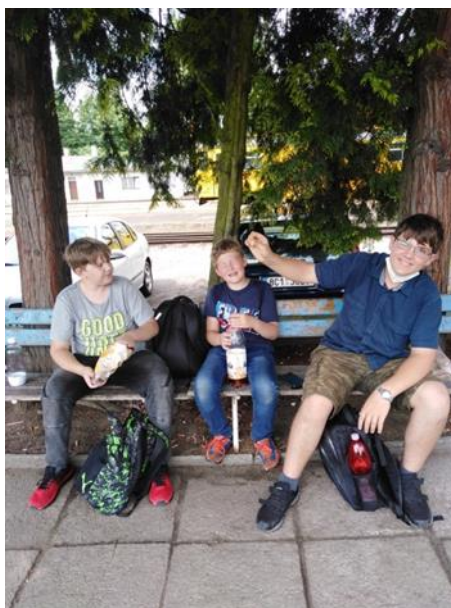
Čekání na spoj do Veselí nad Lužnicí.