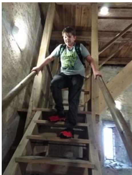
... a vzhůru k oblakům.