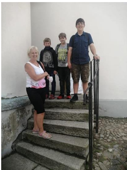
S úsměvem na kostelní věž proboštského kostela Nanebevzetí Panny Marie u 15. poledníku východní délky.