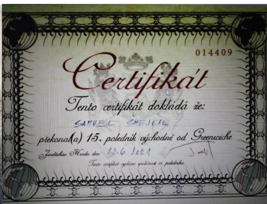
Konečně je to tady – 15. poledník východní délky.