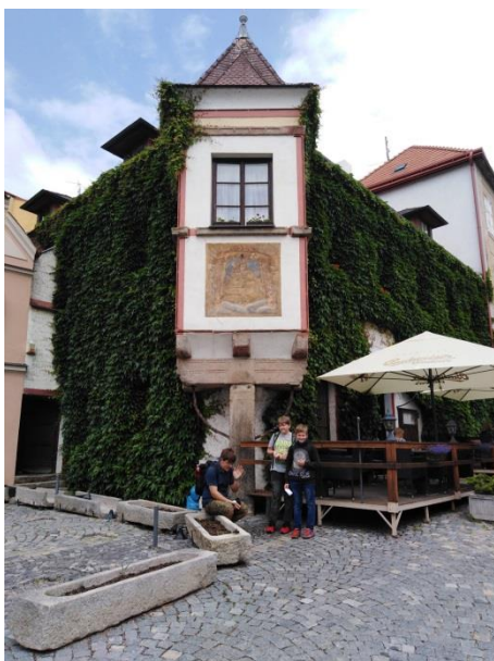
Restaurace u zámku.